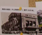
南京大戏院（今上海音乐厅），建于1929年。