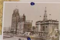
静安寺国际饭店，建于1934年，楼高51.8米，保持上海最高建筑地位长达49年之久。