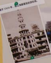
大光明，建于1928年，上海最豪华的豪华场。