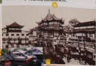
上海老城隍庙的豫园，建于乾隆二十五年（1760年），为上海著名的旅游景点。