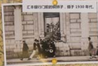
汇丰银行大楼的铜狮子，建于1930年代。